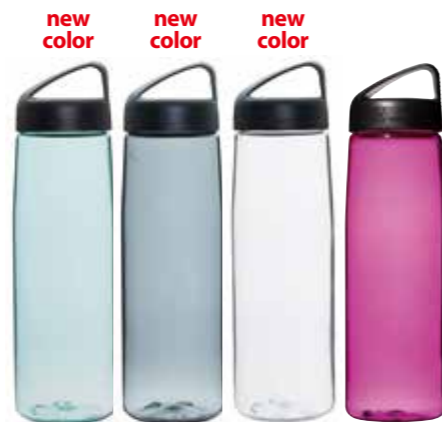
AC(ライトブルー) G(グラナイト) T(クリア) P(ピンク)

PL-TN45 トライタン・クラシック0.45ℓ ¥1,500(税抜) 基準重量:約98g サイズ:φ7.3×17.7cm