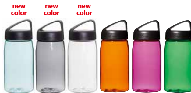
AC(ライトブルー) G(グラナイト) T(クリア) O(オレンジ) P(ピンク) V(グリーン)

PL-TN45 トライタン・クラシック0.45ℓ ¥1,500(税抜) 基準重量:約98g サイズ:φ7.3×17.7cm