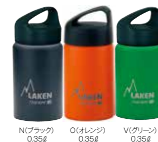
N(ブラック) 0.35ℓ O(オレンジ) 0.35ℓ V(グリーン) 0.35ℓ