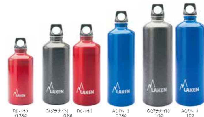
R(レッド) 0.35ℓ G(グラナイト) 0.6ℓ R(レッド) A(ブルー) 0.75ℓ G(グラナイト) 1.0ℓ A(ブルー) 1.0ℓ

PL-70 フツーラ 0.35ℓ ¥1,700(税抜) 基準重量:約96g サイズ:φ6.6×16.2cm PL-71 フツーラ 0.6ℓ ¥2,000(税抜) 基準重量:約120g サイズ:φ7.4×20cm PL-72 フツーラ 0.75ℓ ¥2,100(税抜) 基準重量:約136g サイズ:φ7.4×24cm PL-73 フツーラ 1.0ℓ ¥2,200(税抜) 基準重量:約163g サイズ:φ8.0×26cm