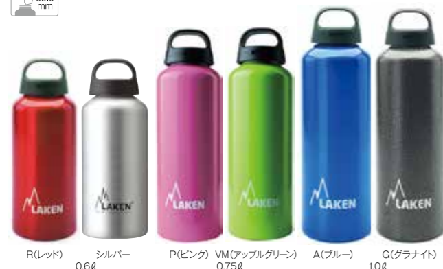
R(レッド) シルバー 0.6ℓ P(ピンク) VM(アップルグリーン) 0.75ℓ A(ブルー) G(グラナイト) 1.0ℓ

PL-31 クラシック 0.6ℓ ¥2,000(税抜) 基準重量:約122g サイズ:φ7.4×19.8cm PL-32 クラシック 0.75ℓ ¥2,100(税抜) 基準重量:約139g サイズ:φ7.4×23.5cm PL-33 クラシック 1.0ℓ ¥2,200(税抜) 基準重量:約163g サイズ:φ8.0×25.7cm