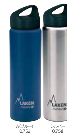
A(ブルー) 0.75ℓ シルバー 0.75ℓ

PL-TA3 クラシック・サーモ 0.35ℓ ¥3,200(税抜) 基準重量:約242g サイズ:φ7.3×16.5cm ■ カラー全7色