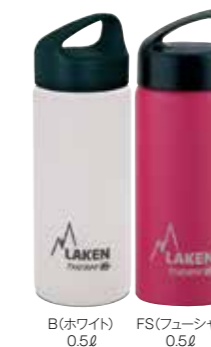
B(ホワイト) 0.5ℓ FS(フューシャ) 0.5ℓ