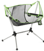
スターゲイズリクライナー