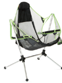
スターゲイズリクライナー ラグジュアリー