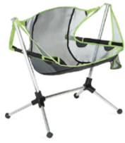
スターゲイズリクライナーロー

2018年3月以降に販売されたNEMOスターゲイズリクライナー全モデル・カラー。 ※ウェビングストラップの不具合にて3月以降に交換対応した製品も含まれます。